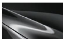
Machine Gray M