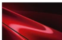
Soul Red Crystal M