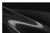
Jet Black MC