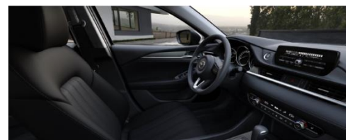
Материал обивки салона - ткань