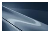
Blue Reflex MC