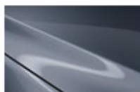
Polymetal Gray M

Цвет «металлик» 890 BYN Цвет Machine Gray 1200 BYN Цвет Soul Red Crystal 1550 BYN