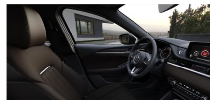
Материал обивки салона - кожа Nappa

Цвет «металлик» 890 BYN Цвет Machine Gray 1200 BYN Цвет Soul Red Crystal 1550 BYN