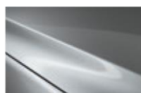
Sonic Silver M