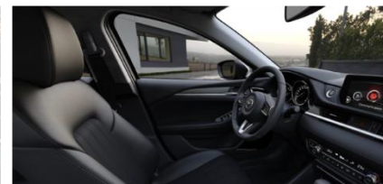
Материал обивки салона - кожа

Цвет «металлик» 890 BYN Цвет Machine Gray 1200 BYN Цвет Soul Red Crystal 1550 BYN