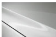
Arctic White CLE