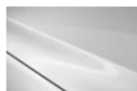
Snowflake White Pearl MC