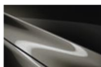
Titanium Flash MC