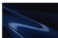
Deep Crystal Blue MC