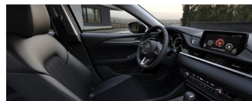
Материал обивки салона - кожа