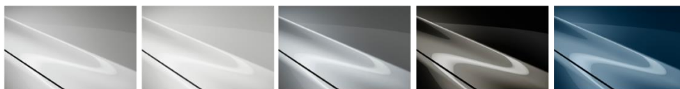
Arctic White Snowflake White Pearl Sonic Silver Metallic Titanium Flash MC Blue Reflex MC