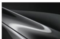
Machine Grey M