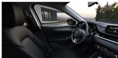
Материал обивки салона - ткань