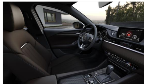
Материал обивки салона - кожа Nappa